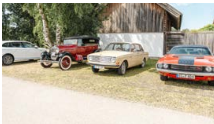
Unser Oldtimer-Shuttleservice bringt die Besucher von einer Location zur anderen.