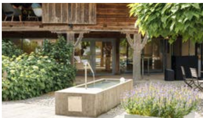
Die Gäste genießen das besondere Ambiente unter dem Motto „Technik trifft Denkmal“.

Das umfassende Marketing mit Einladung (Print/online/SocialMedia) wird von uns übernommen, ebenso das Catering für die komplette Veranstaltung mit Getränken, Frühstücksimbiss, Foodtruck für das Mittagessen und die Weinbar mit frischer Pizza aus dem hauseigenen Holzofen.