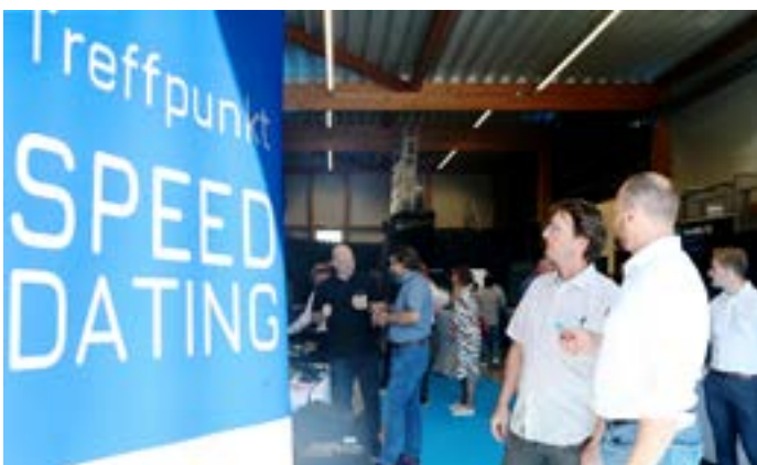
Speed-Dating mit den Ausstellern.