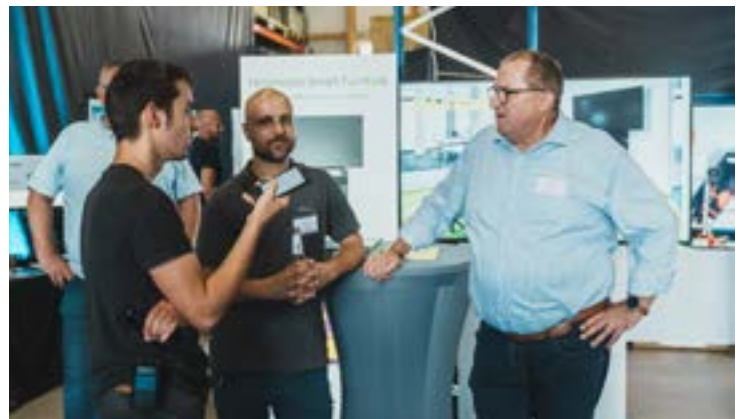
Die Fachausstellung ist ganztägig geöffnet und auch während der Vorträge in Litzelkirchen geöffnet.