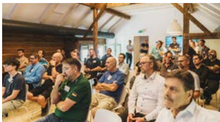
Im großen Konferenzbereich unseres Showrooms finden die Vormittagsvorträge statt.