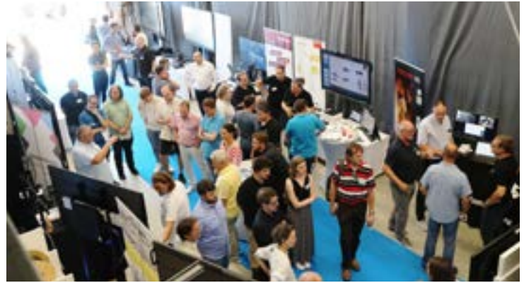
Blick auf den Ausstellerbereich in unserer Fertigung.