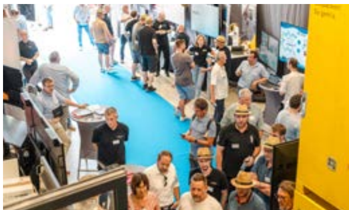
In unserer Fertigung findet ganztägig die Fachausstellung statt.