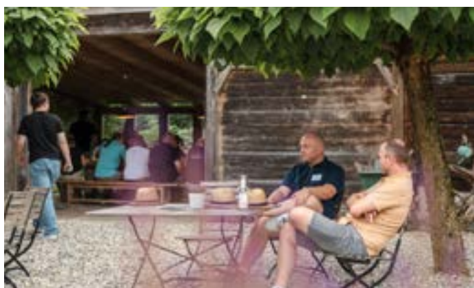
Im hauseigenen Biergarten steht Networking und Fachsimpeln im Vordergrund – natürlich mit kühlen Getränken.