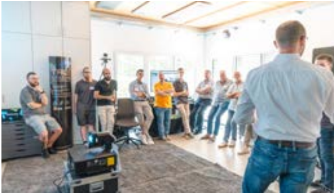
Auch in unserer „Werkstatt“ sind Ausstellungsflächen verfügbar.

präsentiert werden können. Wir stellen Tische und – nach Absprache – die technische Infrastruktur zur Verfügung.