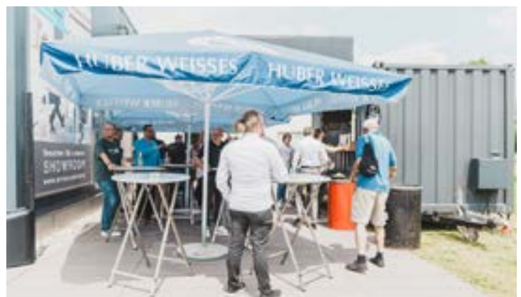
Der Foodtruck von „Boarisch BBQ“ serviert in der Mittagspause auf dem Gelände der Fertigung Gerichte mit und ohne Fleisch. Getränke natürlich auch!